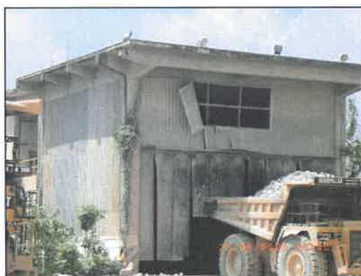
รูปที่ 2-13 โรงโม่หินปูน