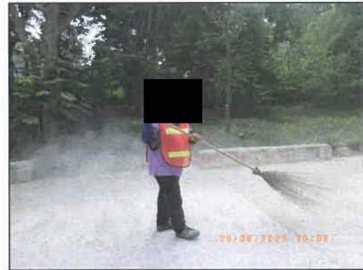
รูปที่ 2-11 พนักงานทำความสะอาดถนนลาดยาง และถนนคอนกรีต