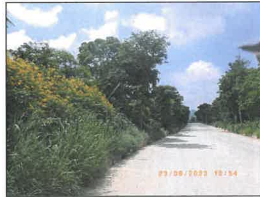
รูปที่ 2-35 ต้นไม้ยืนต้นริมทางลำเลียงแร่ภายในพื้นที่โครงการ