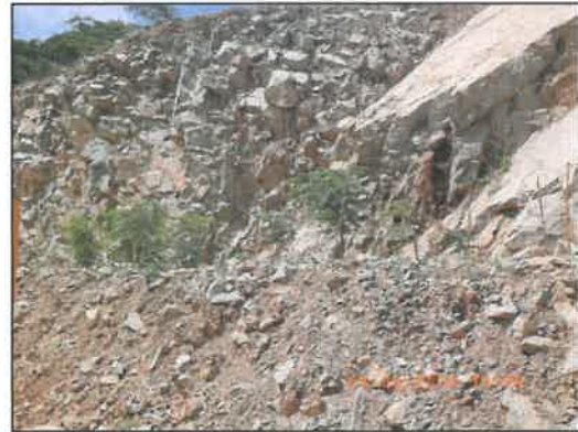
รูปที่ 2-5 (ต่อ) การปลูกต้นไม้ เพื่อฟื้นฟูพื้นที่ภายหลังการทำเหมือง