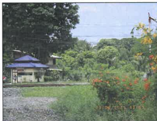
รูปที่ 2-36 (ต่อ) สภาพป่าไม้บริเวณเส้นทางรถไฟและริมถนนมิตรภาพ