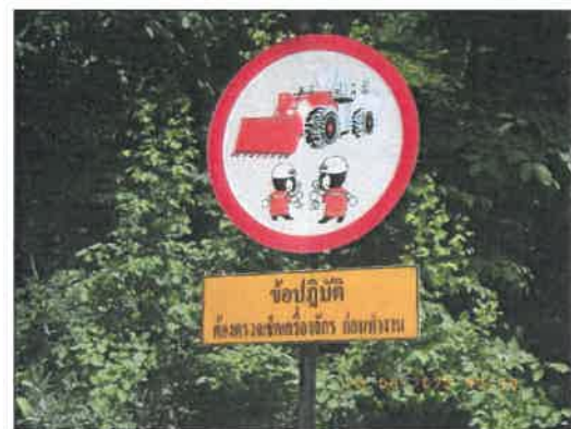
รูปที่ 2-33 ป้ายเตือนและป้ายสัญลักษณ์แสดงเขตอันตราย