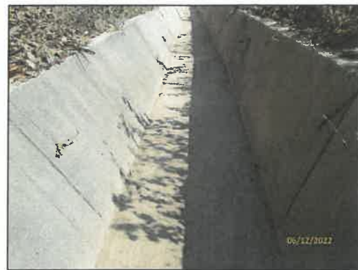
รูปที่ 2-23 รางระบายน้ำในพื้นที่โครงการ