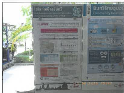
รูปที่ 2-31 บอร์ดประชาสัมพันธ์ข้อมูลข่าวสารของโครงการประจำชุมชน