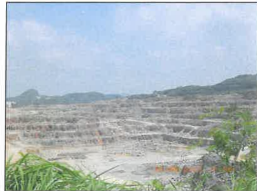
รูปที่ 2-3 การเปิดหน้าเหมืองหินปูนของโครงการ