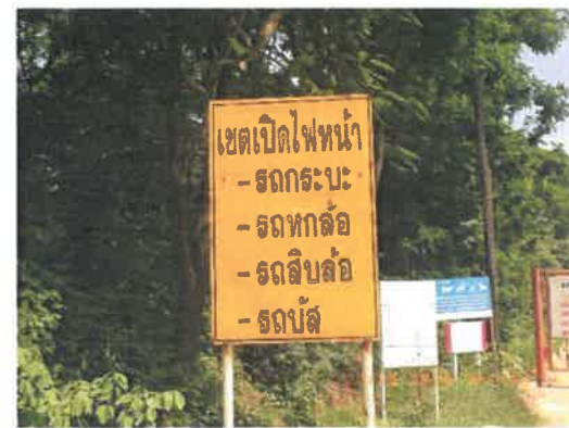
รูปที่ 2-19 ป้ายจราจรภายในโครงการ และตามแนวเส้นทางลำเลียงภายในโครงการ