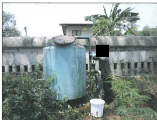
บ้านทับทิม (หมู่ 4)