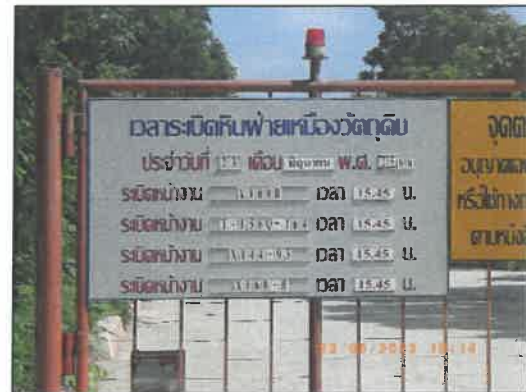
รูปที่ 2-21 ป้ายแจ้งวัน เวลา และจุดระเบิดหิน ของโครงการ