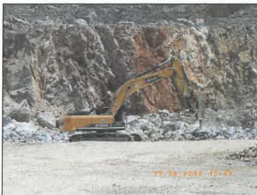
รูปที่ 2-22 รถ Hydraulic Breaker