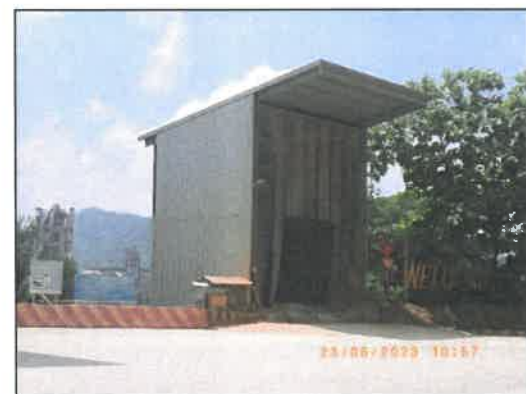
รูปที่ 2-14 โรงโม่หินดินดาน