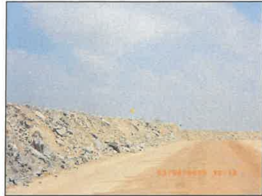
รูปที่ 2-28 แนวเสาสะท้อนแสง บริเวณริมเส้นทางขนส่งแร่