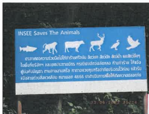
รูปที่ 2-26 ป้ายกฎระเบียบ ห้ามล่าสัตว์ ในเขตพื้นที่ประทานบัตร