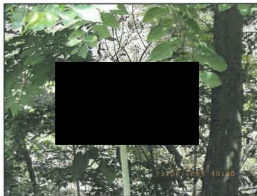
รูปที่ 2-6 ป้ายแสดงพื้นที่ห้ามทำเหมือง