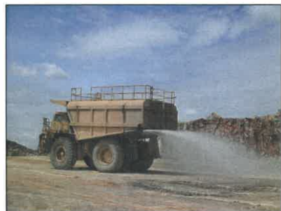
รูปที่ 2-7 รถบรรทุกน้ำฉีดพรมน้ำ เพื่อลดการฟุ้งกระจายของฝุ่นละออง