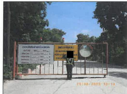
รูปที่ 2-9 เจ้าหน้าที่อำนวยความสะดวก และตรวจตราประจำโครงการ