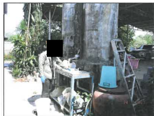
บ้านหนองมะค่า (หมู่ 6)