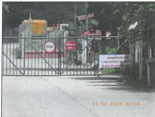
รูปที่ 2-20 เขตอันตรายบริเวณคลังระเบิด