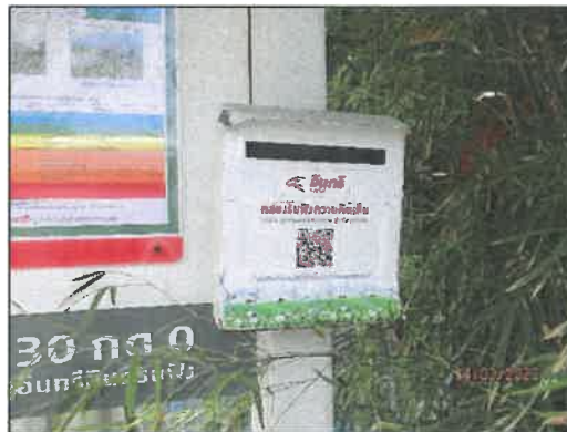
รูปที่ 2-1 กล่องรับเรื่องร้องเรียนประจำพื้นที่ชุมชน