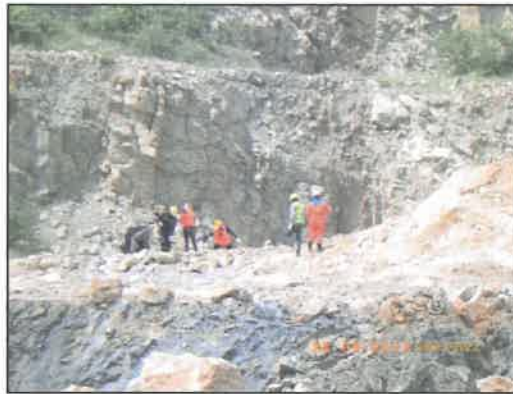
รูปที่ 2-32 พนักงานสวมใส่อุปกรณ์ป้องกันอันตรายส่วนบุคคล (PPE)