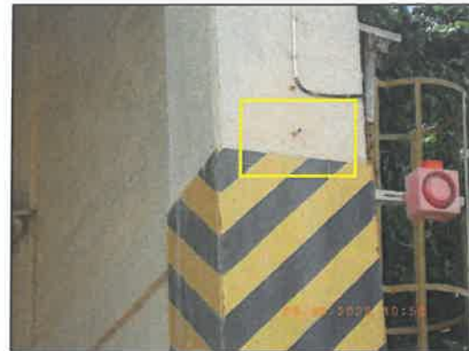
รูปที่ 2-15 ม่านริวและระบบสเปรย์น้ำบริเวณโรงโม่