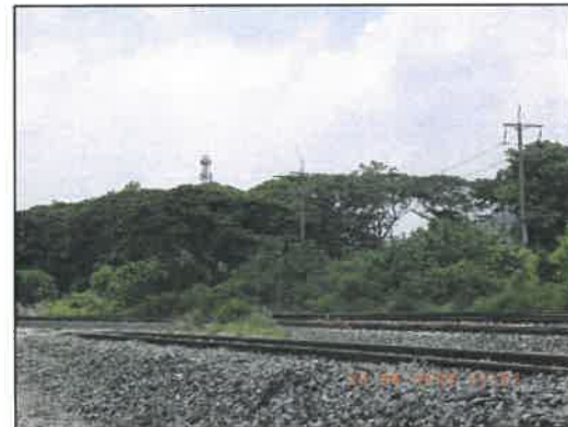
รูปที่ 2-36 สภาพป่าไม้บริเวณเส้นทางรถไฟและริมถนนมิตรภาพ