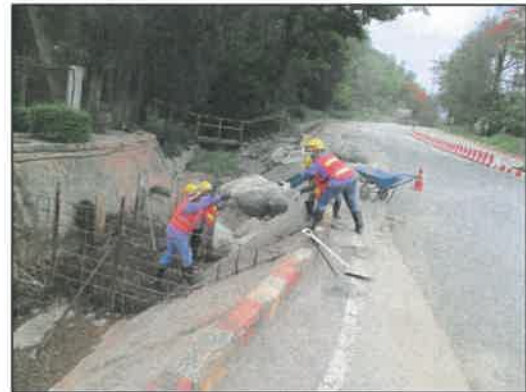
รูปที่ 2-25 พนักงานทำความสะอาดรางระบายน้ำ