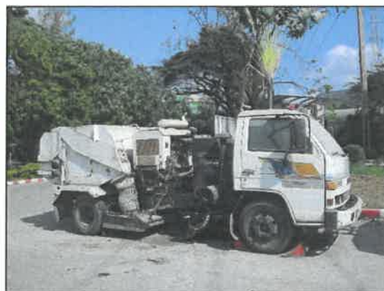
รูปที่ 2-10 รถดูดฝุ่นบนถนน