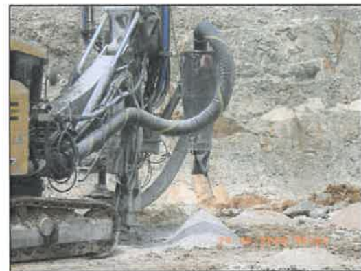
ภาพที่ 2-12 เครื่องเจาะระเบิดที่ติดตั้งเครื่องดักจับฝุ่นแบบถุงกรอง (Dust Collector)