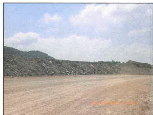
รูปที่ 2-27 แนวคันดินบนถนนขนส่งแร่