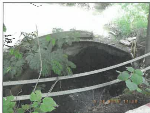
รูปที่ 2-24 ป่อดักตะกอน