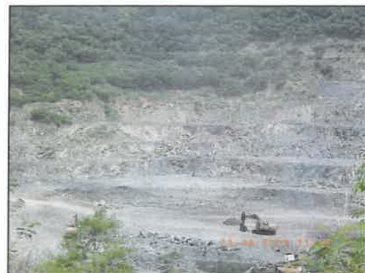
รูปที่ 2-4 การเปิดหน้าเหมืองหินดินดานของโครงการ