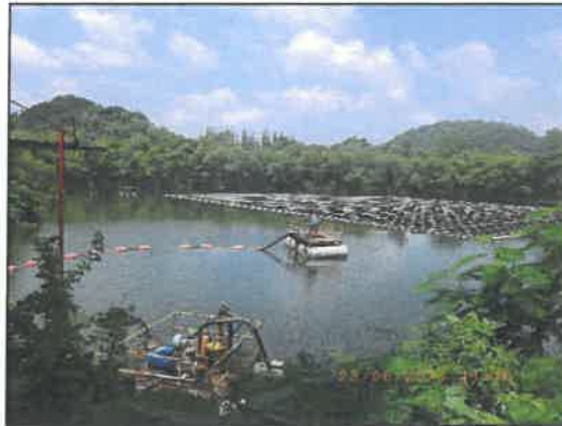
รูปที่ 2-8 บ่อกักเก็บน้ำ เพื่อใช้หมุนเวียนภายในโครงการ