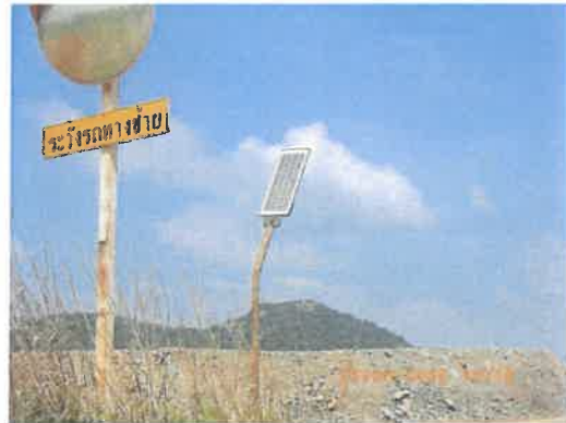
รูปที่ 2-29 เสาไฟชนิดโซล่าเซลล์