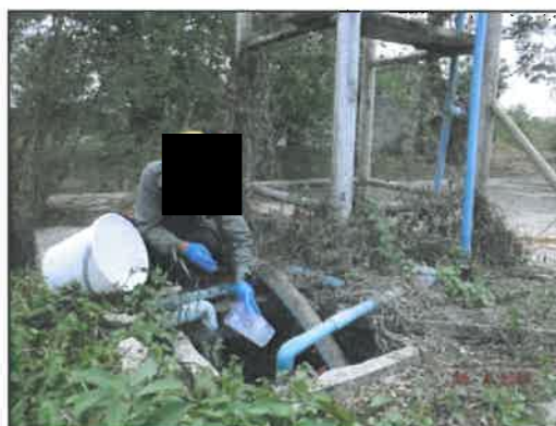
ศูนย์วิจัยและบำรุงพันธุ์สัตว์ทับทิม